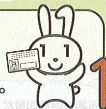
マイナンバー PRキャラクター マイナちゃん