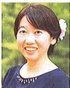
小野税務会計事務所 所長 税理士