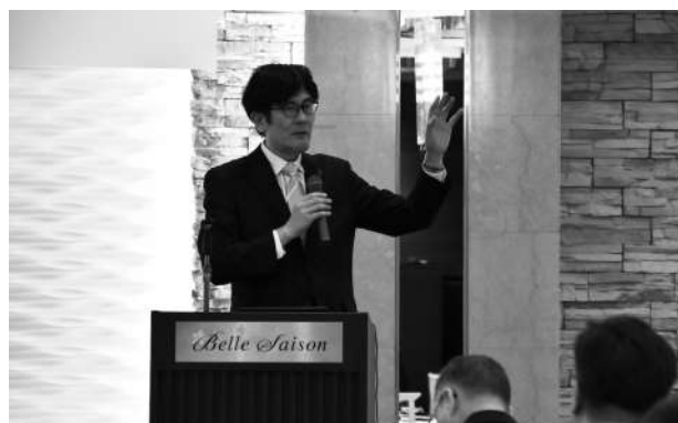
三橋貴明氏 講演会