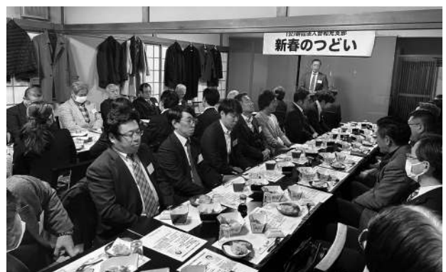
和光支部 新年賀詞交歓会