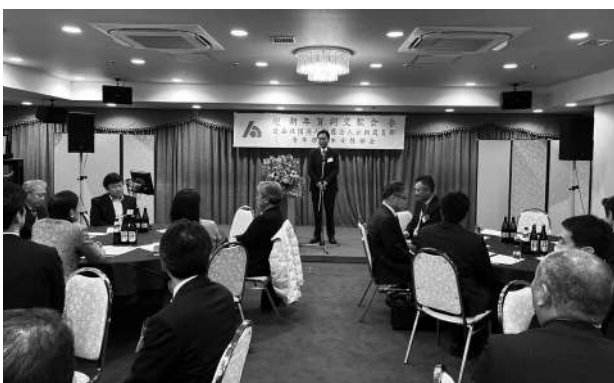
朝霞支部 新年賀詞交歓会