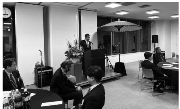
志木支部 新年賀詞交歓会